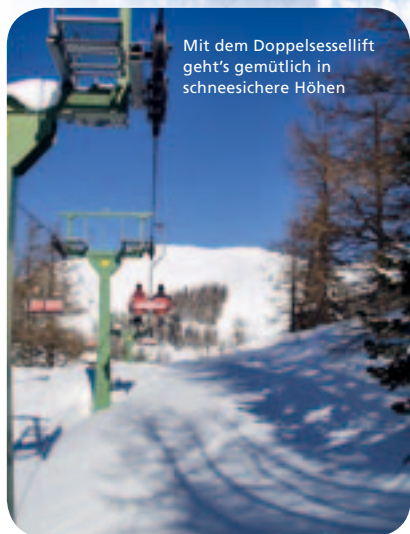
Mit dem Doppelsessellift geht's gemütlich in schneesichere Höhen

2 Sessellifte, 5 Schlepplifte 16 km Abfahrten leicht bis schwer 7 km lange Familien-Panoramaabfahrt bis ins Tal Zahlreiche Gastronomiebetriebe an der Piste und in Aflenz