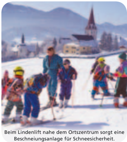
Beim Lindenlift nahe dem Ortszentrum sorgt eine Beschneiungsanlage für Schneesicherheit.