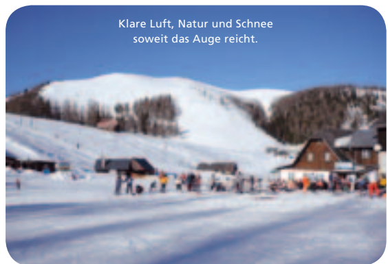
Klare Luft, Natur und Schnee soweit das Auge reicht.